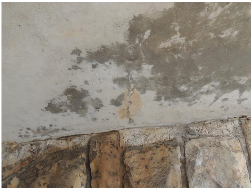
Trhliny v podhledu nosné konstrukce od korodující výztuže