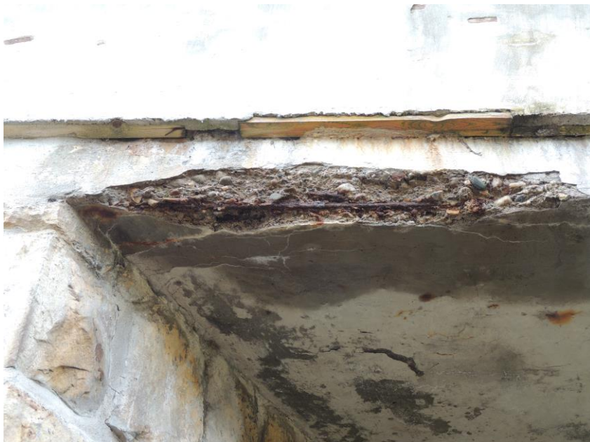
Silně zkorodovaná výztuž nosné konstrukce na výtokové straně mostu nad pravou opěrou