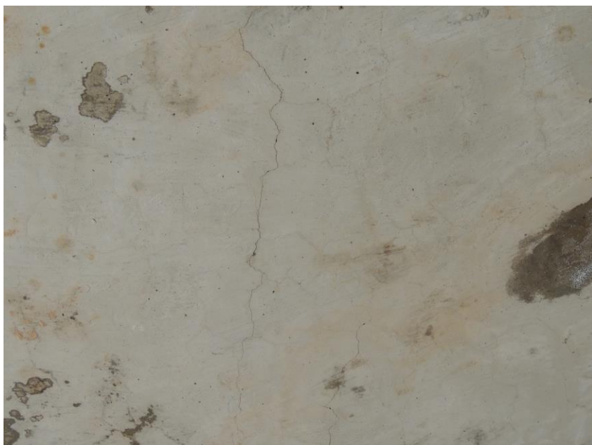
Trhliny v podhledu nosné konstrukce od korodující výztuže