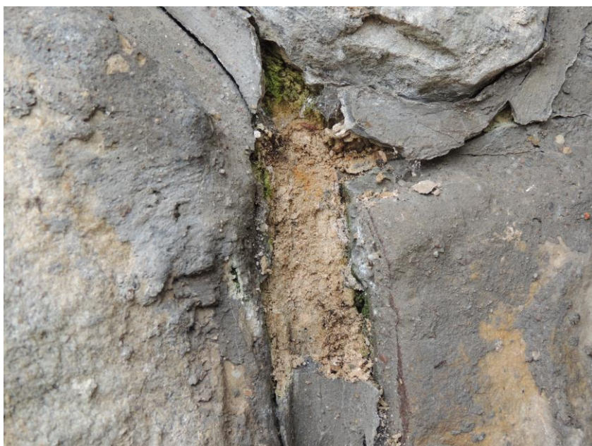
Vydrolená styková malta na levé opěře