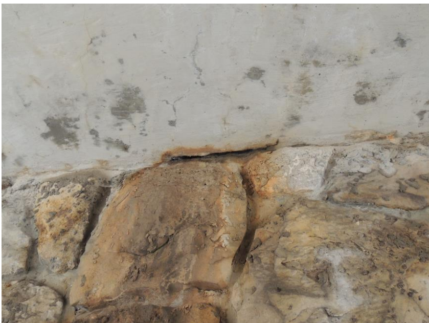
Trhliny v podhledu nosné konstrukce od korodující výztuže