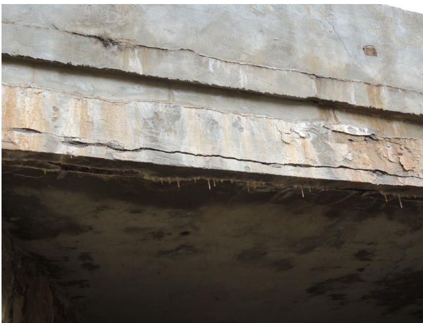
Odseparovaná hrana betonu nosné konstrukce vlivem korodující výztuže na vtokové části mostu