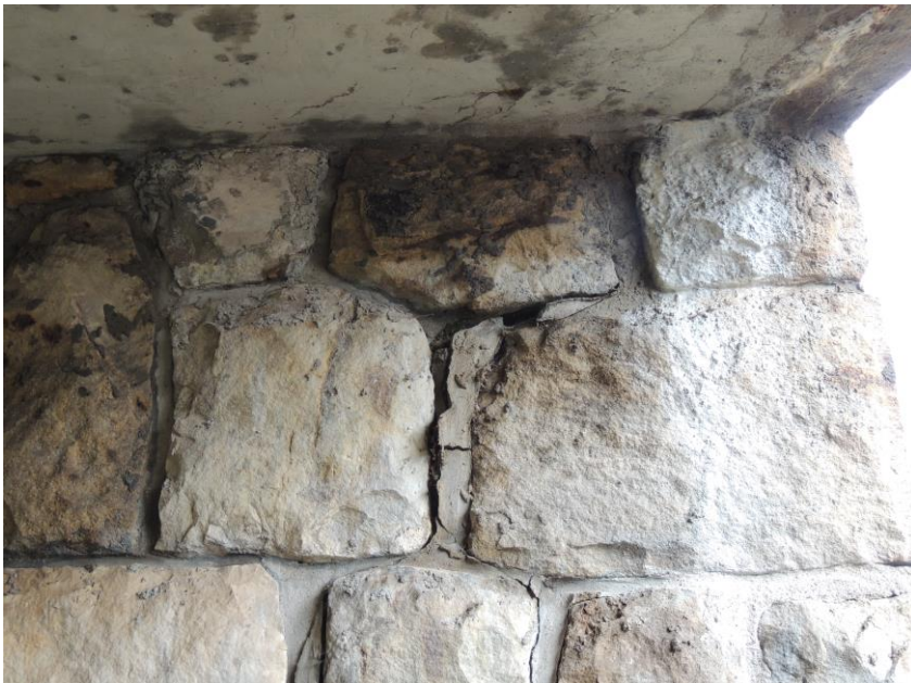
Trhliny v podhledu nosné konstrukce od korodující výztuže, popraskaná a vydrolená styková malta na levé opěře