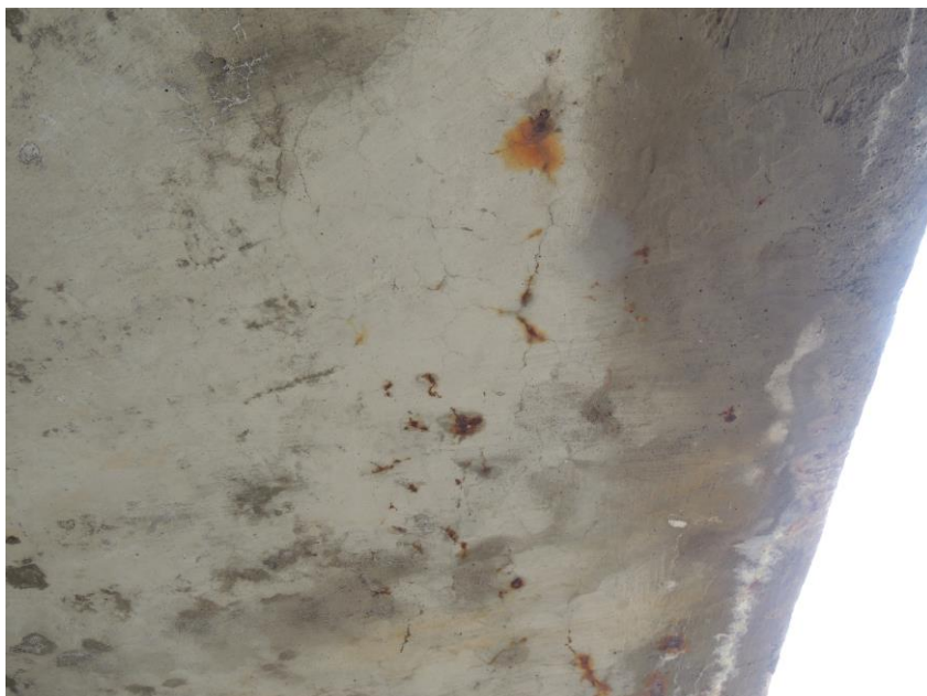
Trhliny v podhledu nosné konstrukce od korodující výztuže