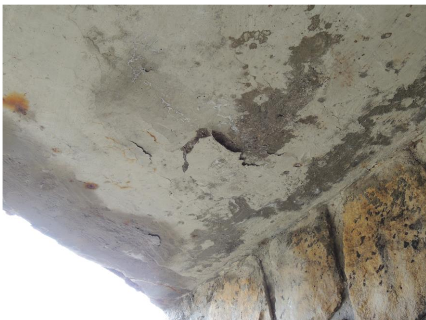
Trhliny v podhledu nosné konstrukce od korodující výztuže