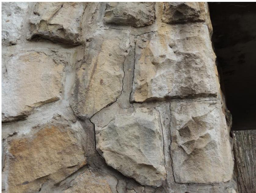
popraskaná styková malta na levé opěře