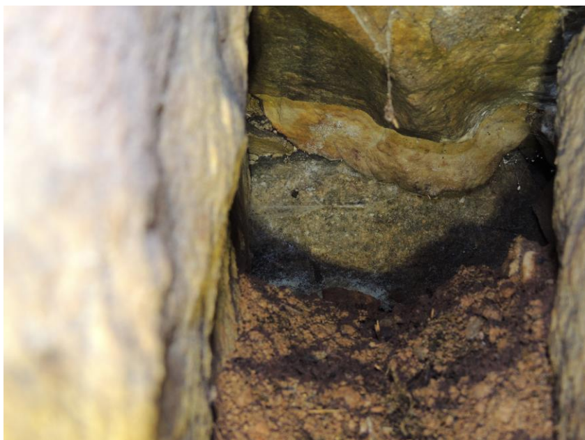
vývod odvodnění přechodových oblastí mostu skrz pravou opěru